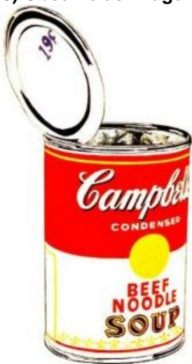
Andy Warhol. Sopa Campbell, 1962. Tinta polimérica sintética.