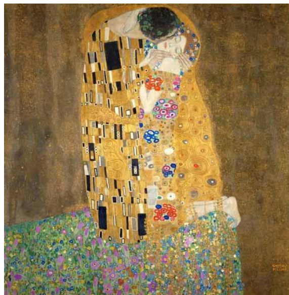
Gustavo Klimt. O Beijo, 1908. Óleo sobre tela.