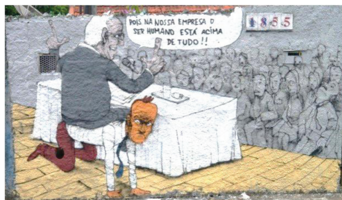
(ITO, Paulo. São Paulo, Vila Madalena, Março 2014.)

A imagem mostra o dirigente de uma companhia falando a seus colaboradores. O líder procura motivar os comandados ao afirmar que “o ser humano está acima de tudo”, é a preocupação central da empresa. Mas se o discurso é motivador, o gesto de sentar sobre um empregado é desalentador. Esse conflito entre o falar e o agir faz com que a cena seja: