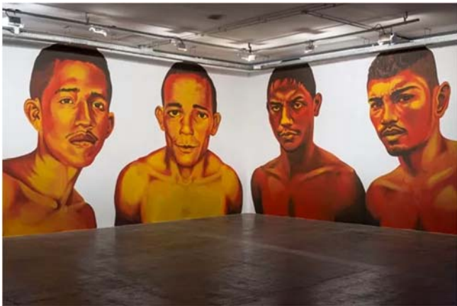
Éder de Oliveira, "Retratos de detentos", Bienal de São Paulo, 2014.

Éder de Oliveira produz, em grandes dimensões, retratos realistas e monocromáticos do homem amazonense, transpondo para as telas, os rostos de pessoas estampados nas páginas criminais de jornais paraenses ou até de detentos.