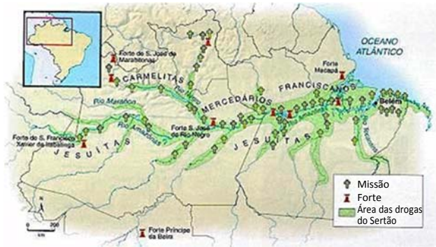
Mapa da ocupação da Amazônia entre os séculos XVI e XVIII.

As afirmativas a seguir caracterizam corretamente as iniciativas de conquista e ocupação do vale do Amazonas no período colonial, à exceção de uma . Assinale-a.