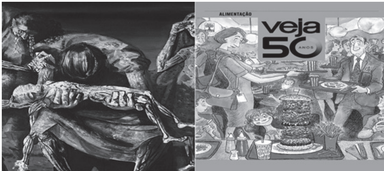
Desigual - A subnutrição e a miséria no pincel de Portinari (Cândido Portinari, Criança morta/MASP/Arte/Veja) e a reportagem: Alimentação: um desafio fenomenal. O equilíbrio à mesa não está só na quantidade.

Desde 2013, mais de 50% dos brasileiros se encontram acima do peso, e, para piorar, os especialistas estão alarmados com o avanço do problema na população infantil. Mas há um aspecto que agrava esse quadro: o aumento da taxa de mortalidade infantil no Brasil, um indicador que vinha caindo nos últimos 26 anos, sem falhar um único ano. Agora, com a severidade da crise e o corte nos gastos sociais, ela voltou a subir. Hoje, de cada 1 000 crianças nascidas vivas, catorze morrem antes de completar 1 ano. É um número que pode recolocar o Brasil no mapa da fome da ONU, do qual havíamos saído, orgulhosamente, em 2014.