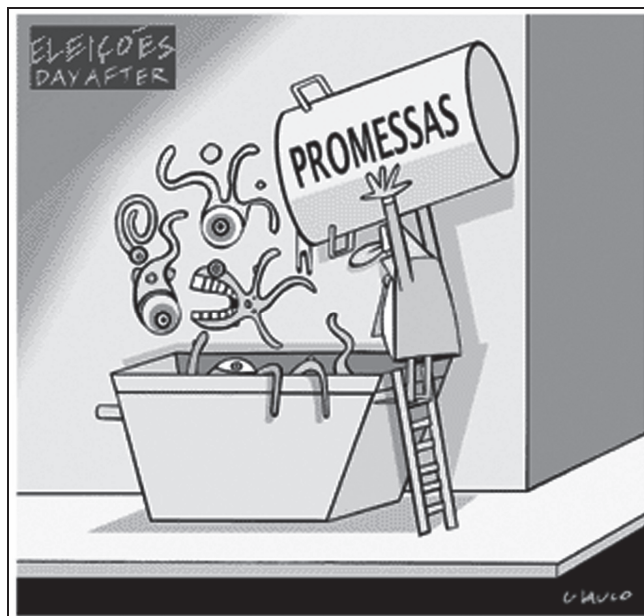
(Glauco. Folha de São Paulo, 31 de outubro de 2008.)

Passada cada eleição, os cidadãos têm a sensação de que todas as promessas de campanha acabam no lixo, conforme ilustrado pela charge do Glauco.