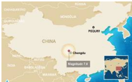
Mapa localiza epicentro do terremoto na China

O terremoto que atingiu a China no último dia 12 de maio, com intensidade 7.9 na escala Richter, liberou energia equivalente a 900 bombas atômicas como a que destruiu Hiroshima.