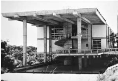
I - Faculdade de Arquitetura da UFBA

Observe as imagens a seguir, que exemplificam diversas tendências arquitetônicas presentes na cidade de Salvador.