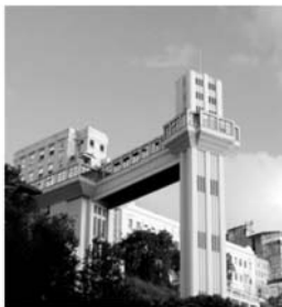
II - Elevador Lacerda