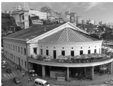
IV - Mercado Modelo

Com base nas imagens, podemos afirmar que o modernismo arquitetônico está representado em