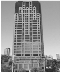
III - Edifício Suarez Trade Center