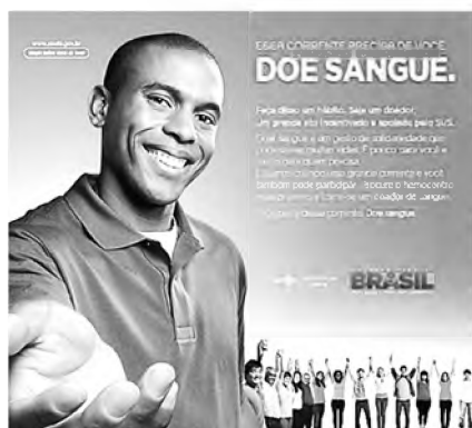
(Figura ampliada na página 13)

Disponível em: < https://www.into.saude.gov.br >. Acesso em: 27 dez. 2016, com adaptações.