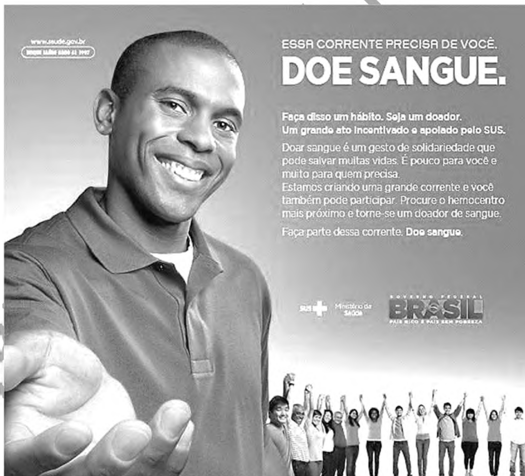
Figura ampliada do Texto 1 da prova discursiva.