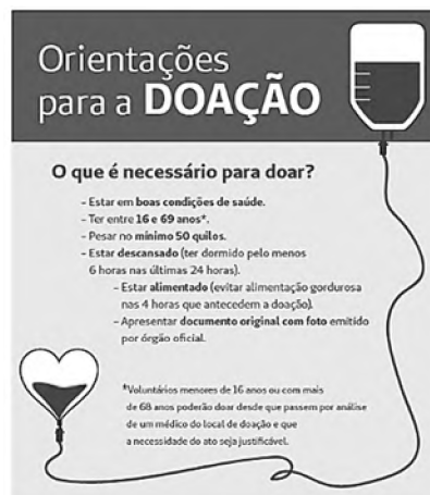
(Figura ampliada na página 13)

Texto 2 para responder às questões 4 e 5.