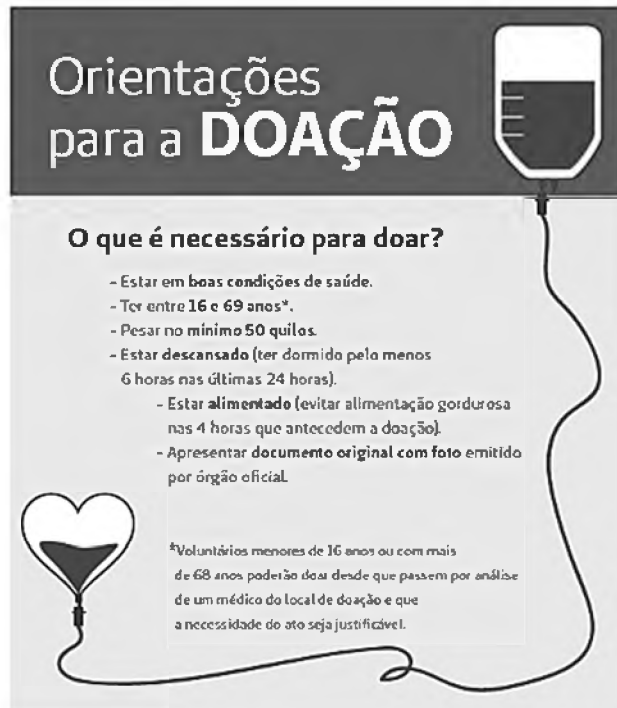
Figura ampliada do Texto 2.