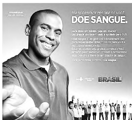
(Figura ampliada na página 13)

Disponível em: < https://www.into.saude.gov.br >. Acesso em: 27 dez. 2016, com adaptações.