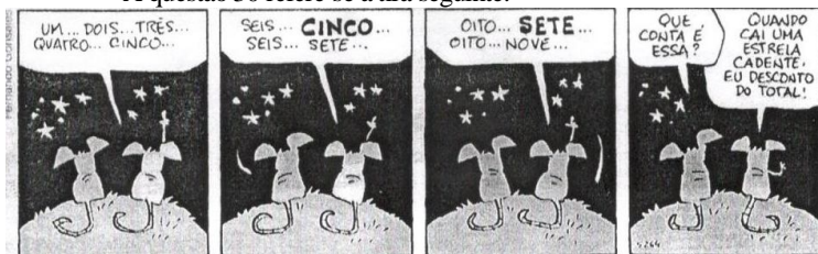
(Fernando Gonsales. Cadê o ratinho do titio. São Paulo: Devir, 2011. p. 10.)

30 - A respeito da oração “Quando cai uma estrela cadente”, indique o tipo de relação que ela mantém com a outra oração.