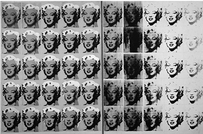
Andy Warhol. Marilyn Diptych , 1962, acrílica sobre tela, 200,54 cm × 144,80 cm.

A Pop Art surgiu em meados da década de 50 do século passado no Reino Unido e no fim da mesma década nos Estados Unidos da América. Entre os expoentes britânicos incluem-se Eduardo Paolozzi e Richard Hamilton; entre os norte-americanos, Jasper Johns e Robert Rauschenberg. Seu maior expoente é Andy Warhol, cujo legado é inegável.