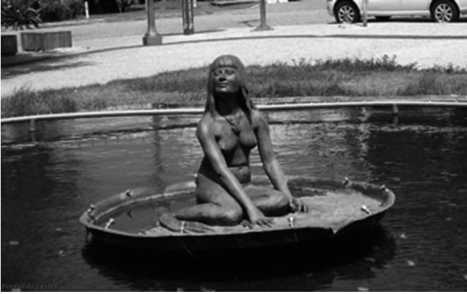
Newton Sá. Mãe D'Água Amazonense, escultura.

Recentemente, o titular da Vara de Interesses Difusos e Coletivos, condenou um hotel e o Município de São Luís a procederem aos serviços de restauração da estátua da Mãe D'água Amazonense , localizada na Praça Dom Pedro II. A obra é de autoria do artista plástico maranhense Newton Sá, nascido em Colinas – MA, no ano de 1908.