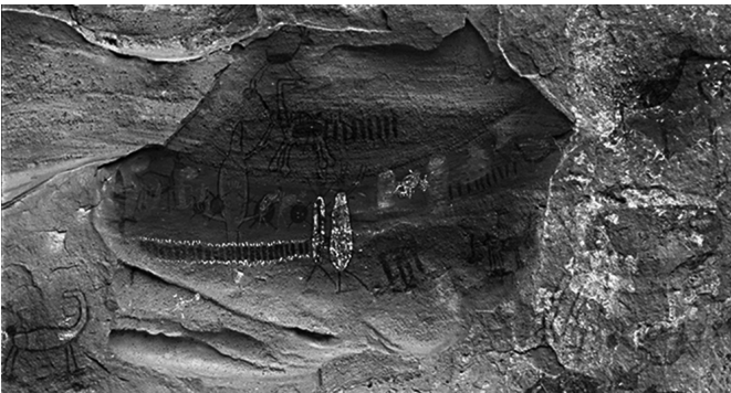
Pinturas rupestres na Toca do Boqueirão da Pedra Furada no Parque da Serra da Capivara-PI.