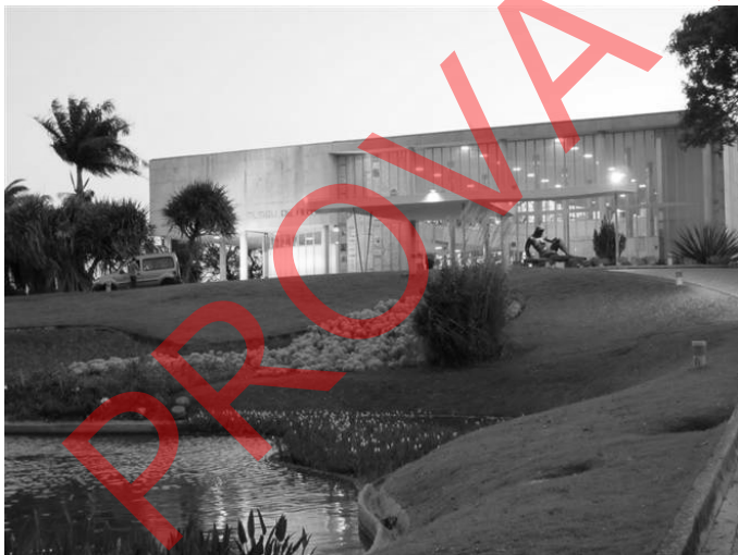
Museu de Arte Moderna de Belo Horizonte.

O Museu de Arte Moderna de Belo Horizonte foi a primeira obra do conjunto da Pampulha, projeto de Oscar Niemeyer e projeto urbanístico de Lúcio Costa. Este projeto apresenta características da arquitetura moderna que inclui