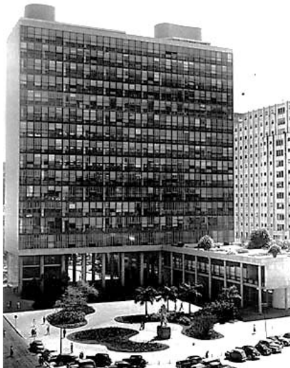
Edifício Gustavo Capanema - Antigo Ministério da Educação/RJ, 1936.

A arquitetura brasileira é conhecida mundialmente. Le Corbusier desenvolveu uma teoria acerca do modernismo, na qual se destacam os 5 pontos da arquitetura moderna, chamados de 5 pontos de Le Corbusier. Alguns desses 5 pontos são claramente notados no Ministério da Educação, um edifício projetado por Lúcio Costa com a consultoria de Le Corbusier. Nesse contexto e com base na imagem acima, assinale a alternativa que apresenta um desses pontos.