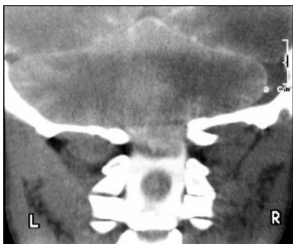
Fig 1. Caso 1. Mielotomografia da junção crânio-cervical, plano coronal, demonstrando a presença de ectopia cerebelar através do forame magno e de siringomielia ao nível da medula espinhal cervical.

Paciente sexo feminino, 16 anos, admitida na unidade de terapia intensiva com quadro de dispneia, cianose, hipoxemia e hipercapnia severa. Havia antecedente de déficit pondero-estatural e retardo do desenvolvimento dos caracteres sexuais secundários. Ao exame neurológico: presença de nistagmo vertical, tipo "downbeating", sinais piramidais bilaterais nos membros inferiores, discreta atrofia dos músculos interósseos das mãos bilateralmente e ataxia de marcha (avaliado posteriormente). Foi realizada mielotomografia da junção crânio-cervical (que aparece abaixo) revelou a presença de ectopia cerebelar e de siringomielia na medula espinhal cervical.