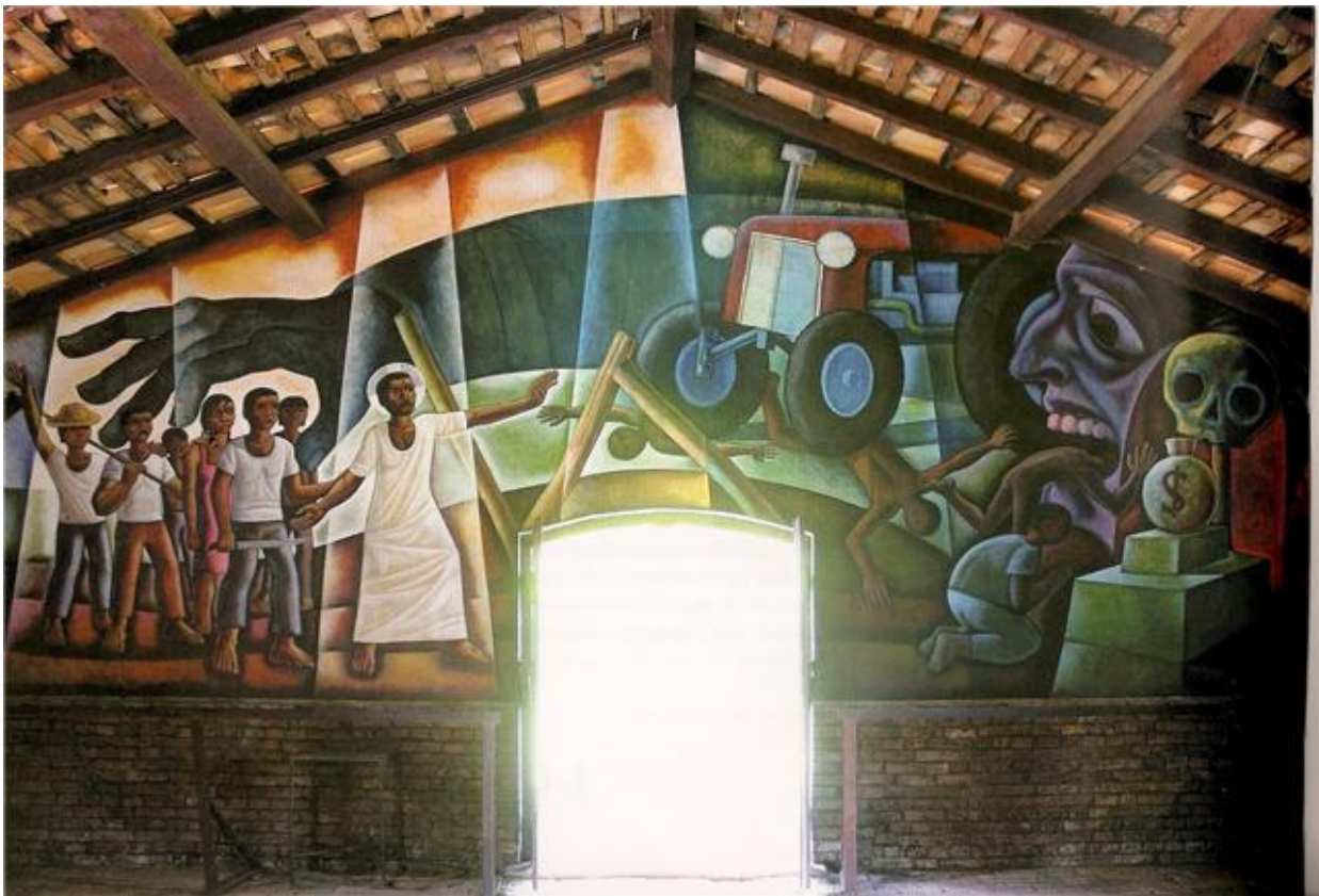
Mural da Libertação - O Reino e Anti-Reino. Na Igreja do Morro de Areia, em Santa Terezinha, 1989. Maximino Cerezo Barredo. In: CASALDÁLIGA, Pedro e BARREDO, Maximino Cerezo. Murais da Libertação na Prelazia de São Félix do Araguaia, Mato Grosso, Brasil . Fotografias: José María Concepción. São Paulo: Edições Loyola, 2005. p.10.

Essa pintura mural registra a visão da Igreja Católica acerca das relações entre empresas, projetos agropecuários, posseiros e indígenas no Nordeste de Mato Grosso durante o período militar. Sobre essas relações, assinale a afirmativa correta.