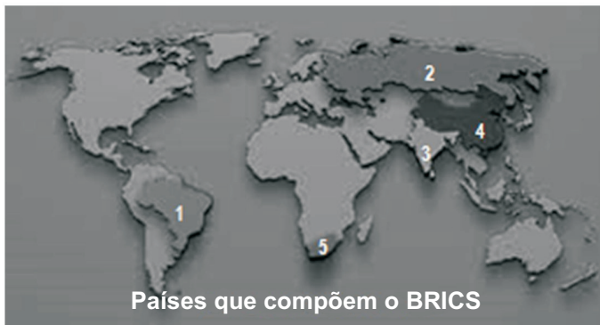
Países que compõem o BRICS

A ideia dos BRICS foi formulada pelo economista-chefe da Goldman Sachs, Jim O'Neil, em estudo de 2001, intitulado “Building Better Global Economic BRICs”. Fixou-se como categoria da análise nos meios econômico-financeiros, empresariais, acadêmicos e de comunicação. Em 2006, o conceito deu origem a um agrupamento de nações, ao qual, em 2011, se somou a última nação, por ocasião da III Cúpula dessas nações, que adotou a sigla BRICS.