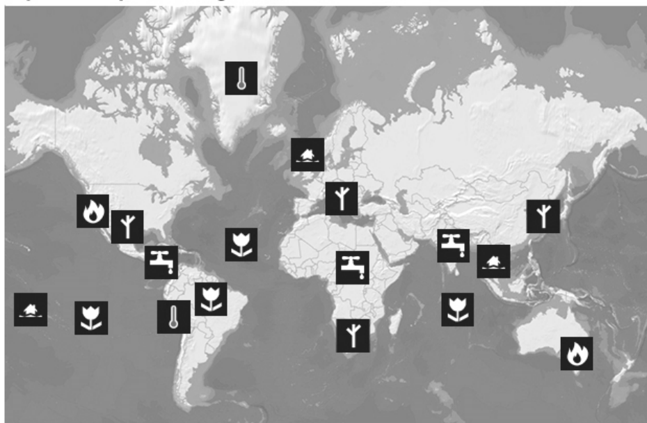
Impacto do aquecimento global no mundo

Analise a figura para responder às questões 34 e 35.