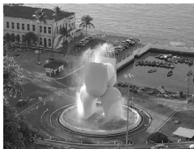
Mario Cravo Júnior, Fonte da Rampa do Mercado (Salvador/Bahia, 1970).