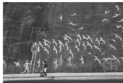
Bel Borba, Mosaicos , Avenida do Contorno (Salvador/Bahia, 1998).