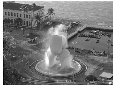
Mario Cravo Júnior, Fonte da Rampa do Mercado (Salvador/Bahia, 1970).