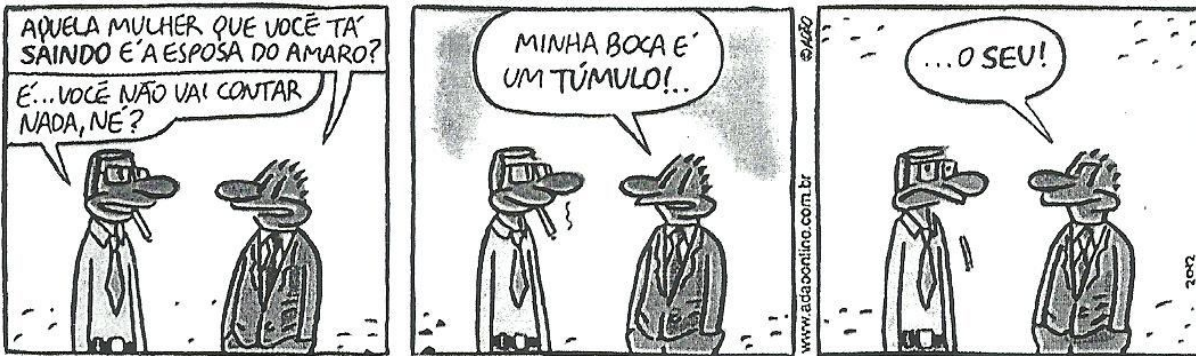
ITURRUSGARAI, Adão. La vie en rose. Folha de S. Paulo, São Paulo, 22 mar. 2003.