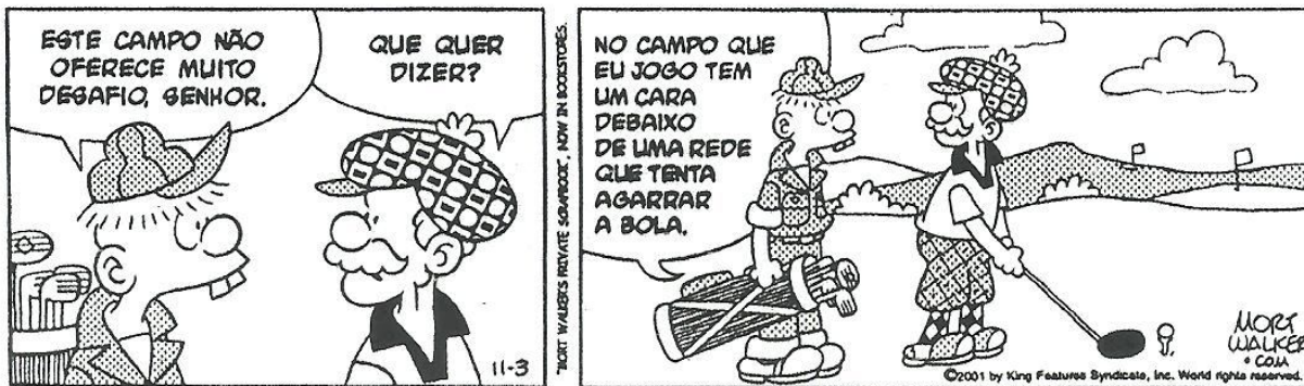
WALKER, Mort. Recruta Zero. O Estado de S. Paulo, São Paulo, 3 fev. 2002.