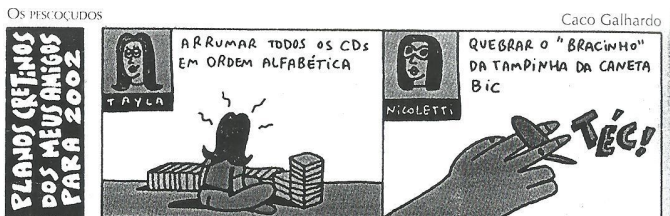
GALHARDO, Caco. Os pescocudos. Folha de S. Paulo , São Paulo, 3 jan. 2002.

37 - No segundo quadrinho da tira é possível identificar a seguinte figura de linguagem: