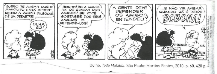
Quino. Toda Mafalda . São Paulo: Martins Fontes, 2010. p. 60. 420 p.

As questões 38 e 39 referem-se a tira seguinte: