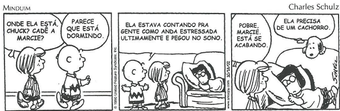
SCHULZ, Charles. Minduim. Jornal da Tarde , São Paulo, 18 dez. 2002.

35 - A oração presente no 2º balão do primeiro quadrinho classifica-se como: