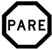
R-1 Parada Obrigatória

28. Relacionando à imagem abaixo, informe que tipo de conjunto de placas ela se enquadra: