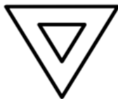
R-2 Dê a preferência