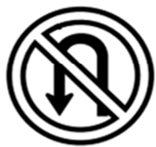
R-5a Proibido Retornar à esquerda