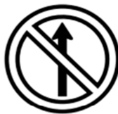
R-3 Sentido proibido