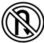
R-5b Proibido Retornar à direita