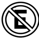
R-6a Proibido Estacionar