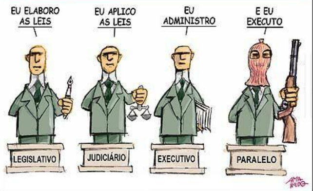
RELAÇÃO DE PODERES NO BRASIL

http://lh6.ggpht.com/_9Yb1le5FGE0/TCA_kCY1qDI/AAAAAAAAAF9o/-k6ivE5gtMw/s1600-h/%5BCHARGE%5D%20entendoomundose5%5B3%5D.jpg