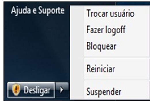
Figura 02: Utilização do Windows 7 Professional.

QUESTÃO 35 – Utilizando o Windows 7 Professional, o usuário deseja desligar o computador, porém verifica que há outras possibilidades de ações, como mostrado na figura 02. Para que serve a opção Suspend ?