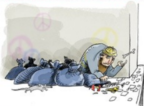
ANOS 70 - CRISE DO PETRÓLEO PODE CAUSAR FOME NO MUNDO