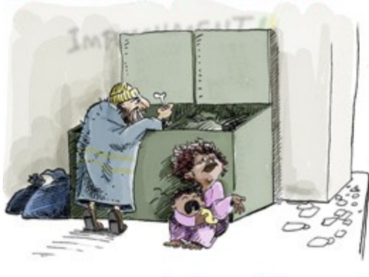
ANOS 90 - GLOBALIZAÇÃO PODE CAUSAR FOME NO MUNDO