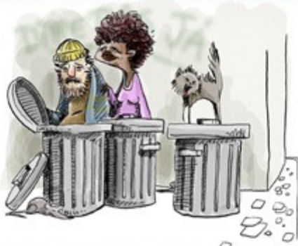
ANOS 80 - DESMATAMENTO PODE CAUSAR FOME NO MUNDO