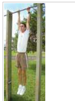
Posição Inicial (1)

A posição de pegada é pronada, (palmas das mãos voltadas para a frente) e correspondente a distância lateral biacromial (dos ombros), braços e pernas estendidas, com o corpo na posição vertical, perdendo contato com o solo(1);