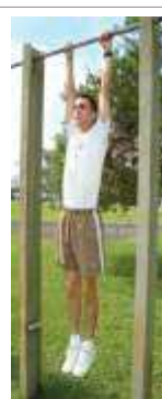
Posição Final (3)